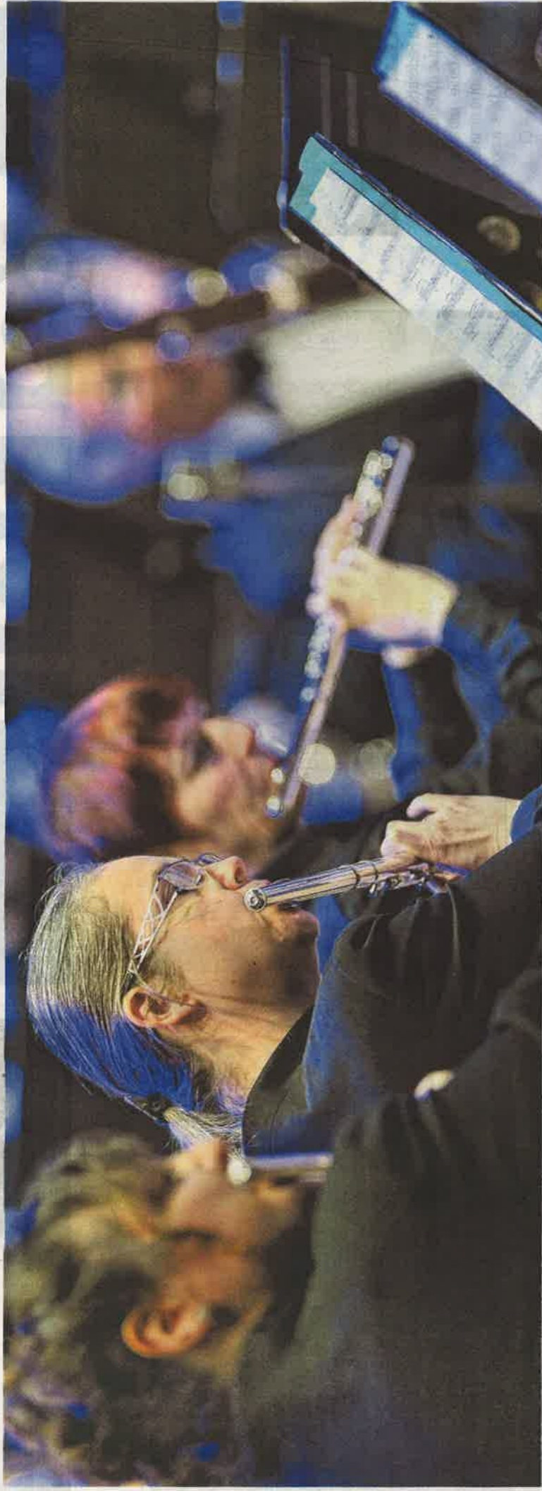
Avec 5,25 % de la population qui pratique de la musique de façon régulière, l'Alsace possède la plus forte densité de musiciens amateurs de France.

ALSACE Plan de recherches Alsace terre de musique et de musiciens